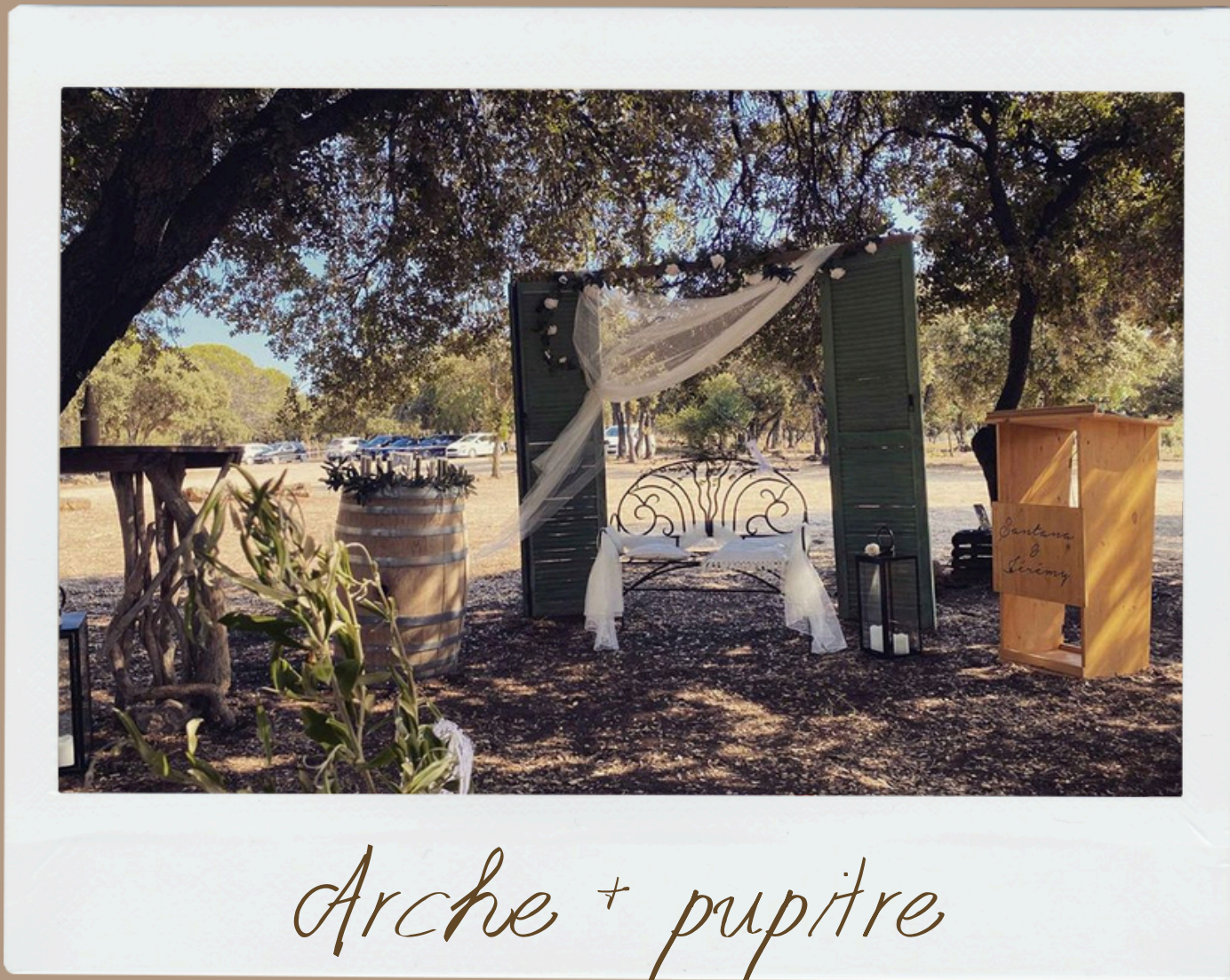
Arche + pupitre